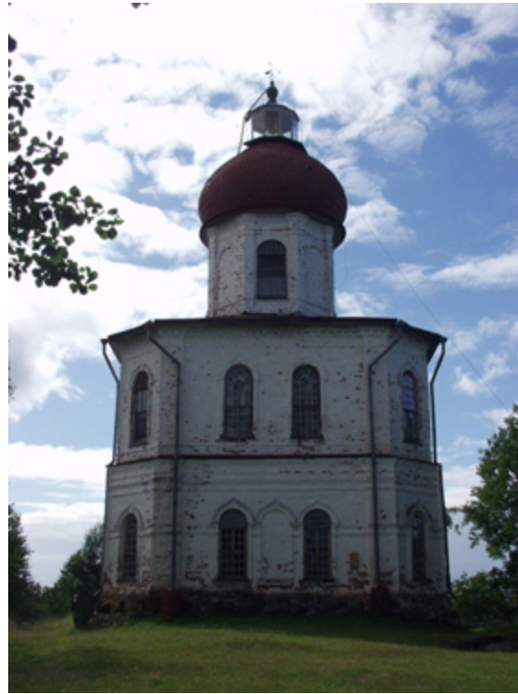
Церковь и маяк с Ю-В.