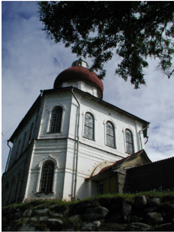
Вид на церковь и маяк с С-З.